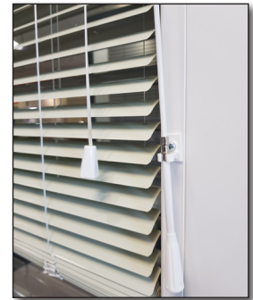
Schnur + Schwenkstange

Die Beschattung der Jalousie erreichen wir so, indem wir die Stange nach LINKS bzw. RECHTS drehen, so wird die gewünschte Raumbeleuchtung eingestellt.